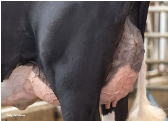
PROGENESIS CHAMPION PALAZZO DAM